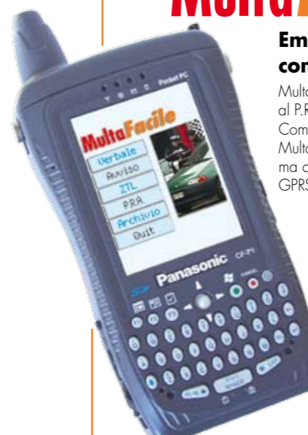
PDA Panasonic CF-P1 munito di tastiera, scheda GPRS, lettore di codice a barre

MultaFacile è la soluzione per l'emissione degli avvisi, l'interrogazione al P.R.A., la verifica dei permessi per le ZTL attraverso PDA e telefono cellulare. Compatibile con diversi sistemi operativi, Windows CE, Palm, Symbian, MultaFacile è totalmente integrata con l'applicazione OPENgov multiforme, ma consente l'upload dei dati anche su sistemi diversi, attraverso quattro modalità: GPRS, Bluetooth, Wi-Fi, o in locale.