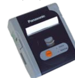
Stampante Panasonic JT-H200PR-50 con tecnologia Bluetooth