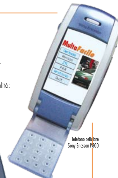
Telefono cellulare Sony Ericsson P800