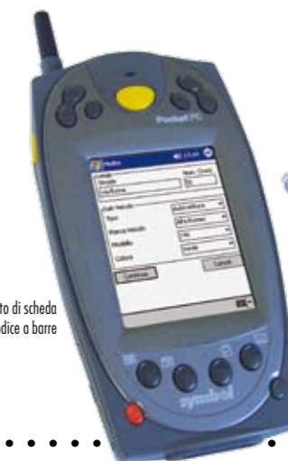
PDA Symbol munito di scheda GPRS e lettore di codice a barre