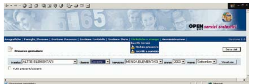
Schermata per la visualizzazione delle presenze giornaliere degli utenti del servizio "mensa"