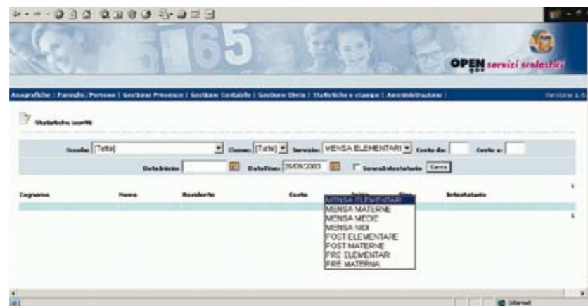
Schermata per la ricerca e la visualizzazione delle statistiche relative agli utenti iscritti ai servizi.

OPENgov servizi scolastici gestisce le informazioni relative agli utenti principali che interagiscono con il sistema, quali le scuole (gestite fino al dettaglio degli alunni inseriti in ogni singola classe), le famiglie, i fornitori del servizio, permettendo loro di interagire sia per l'aggiornamento che per la consultazione dei dati.